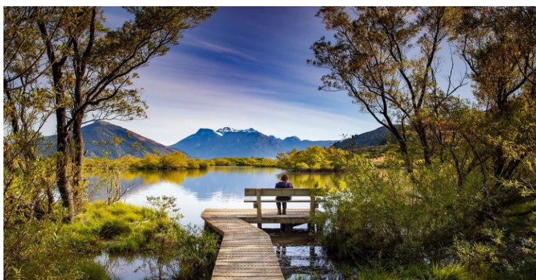
Fijne vakantie iedereen.