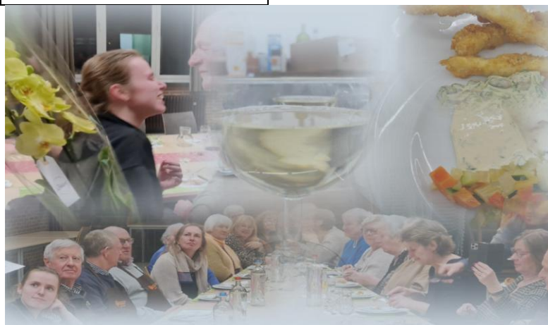
L.G. koken - 2023