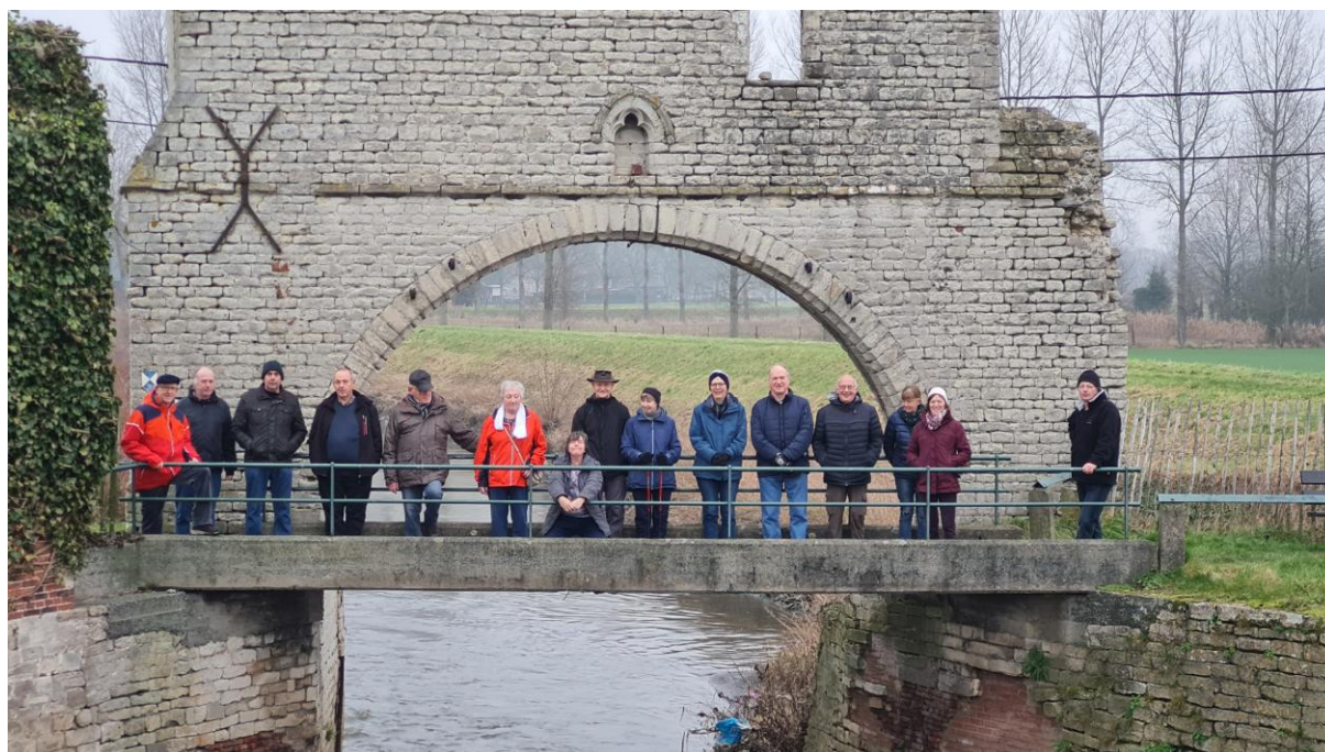
Wandeling 23 januari 2022 te Weerde, aan de 13e-eeuwse ruïne van de sluistoren