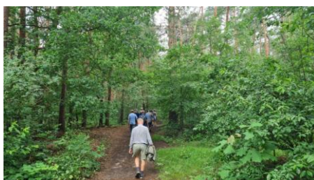
Wandeling te Halle Zoersel van 4 juli.